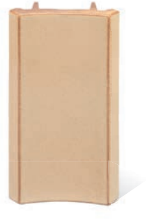
RL - P - R4 - 28 Lisene Lyra 28 Mittelteil