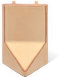
RV - K - R1 - 22 Lisene Walm 22 Endstück