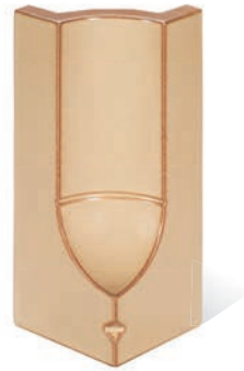
RS - K - R0,2 - 28 Lisene Saphir 28 Endstück