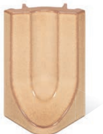
RP - K - R4 - 22 Lisene Hufeisen 22 Endstück