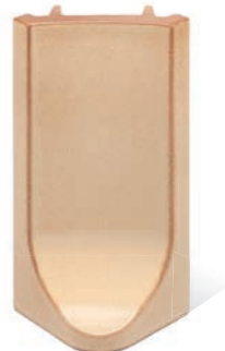
RL - K - R4 - 28 Lisene Lyra 28 Endstück