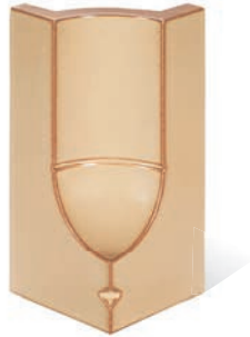
RS - K - R0,2 - 25 Lisene Saphir 25 Endstück