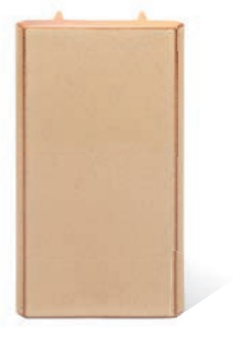
RV - P - R1 - 28 Lisene Walm 28 Mittelteil