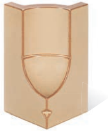
RS - K - R0,2 - 22 Lisene Saphir 22 Endstück