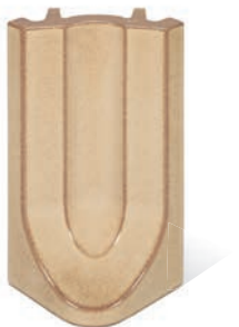
RP - K - R4 - 25 Lisene Hufeisen 25 Endstück