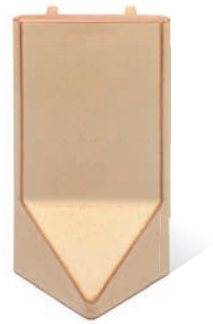
RV - K - R1 - 28 Lisene Walm 28 Endstück