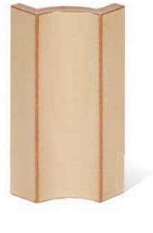
RS - P - R0,2 - 28 Lisene Saphir 28 Mittelteil