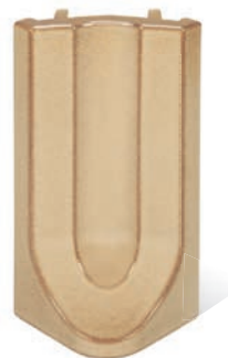
RP - K - R4 - 28 Lisene Hufeisen 28 Endstück