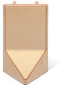
RV - K - R1 - 25 Lisene Walm 25 Endstück