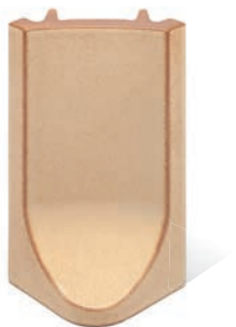
RL - K - R4 - 25 Lisene Lyra 25 Endstück