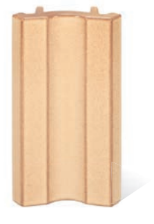
RP - P - R4 - 28 Lisene Hufeisen 28 Mittelteil