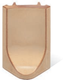
RL - K - R4 - 22 Lisene Lyra 22 Endstück