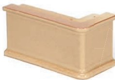
SV - CP - R1 Sockel Ecke R1