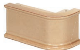
SV - CP - R6,5 Sockel Ecke R6,5