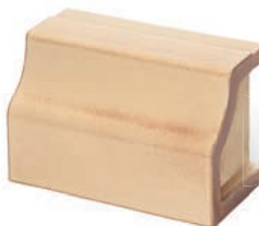
SM - C Sockel MAXIM