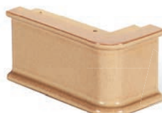
SV - CP - R4 Sockel Ecke R4