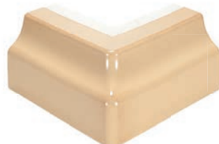
SM - CC - R0,2 Sockel Ecke R0,2