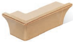
SI - PC - R1 Sockel Ecke R1 - links