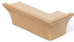
SI - CP - R1 Sockel Ecke R1 - rechts