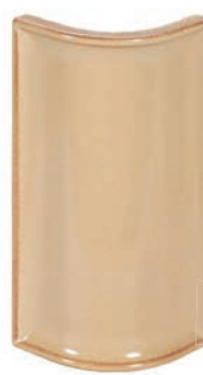
GL - PP - R6,5 Halbecke R6,5