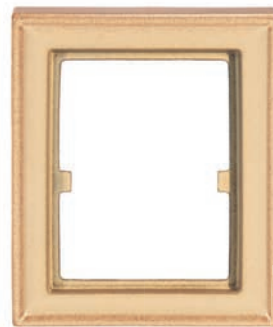
GL - C - CR Einhängkachel