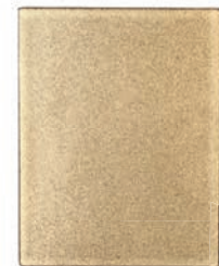
GL - C - CVP Einhängputzdeckel