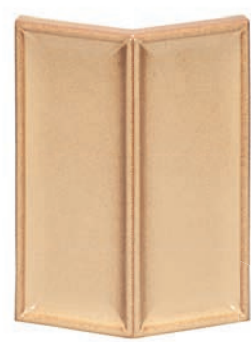
GL - PP - 45 Halbecke 45°