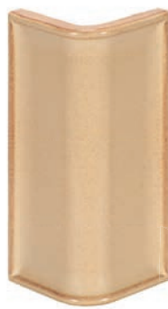
GL - PP - R4 Halbecke R4