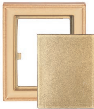
GL - C - C Putzkachel - komplett