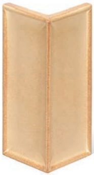
GL - PP - R1 Halbecke R1