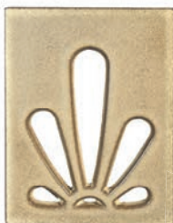
GL - C - CVK Einhänglüfterdeckel - Blüte