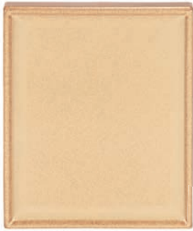
GL - C Kachel GLORIET