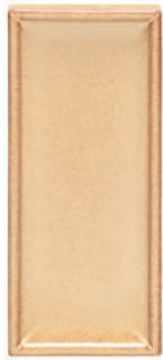
GL - P Halbkachel