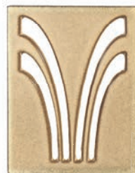
GL - C - CVF Einhänglüfterdeckel - Fontäne