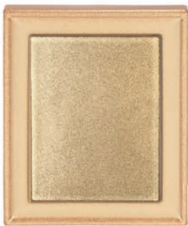
GL - C - C Putzkachel - komplett